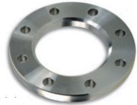
cod. 20.45 oceľ