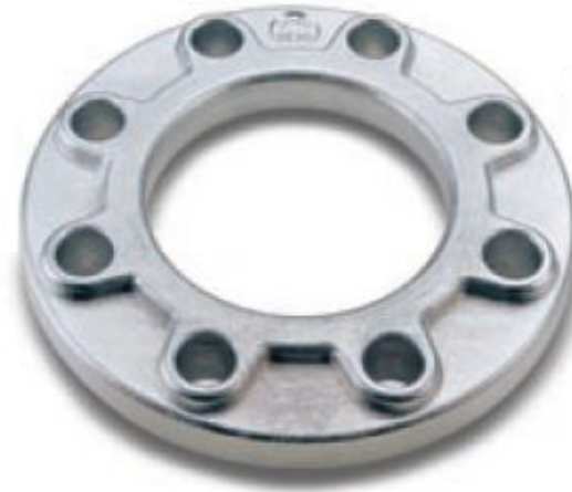
cod. 20.40 hliník