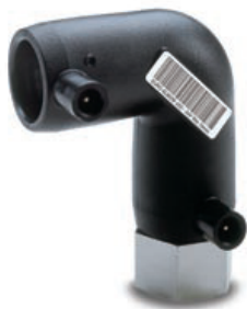
Objednávkové č.: 21.66