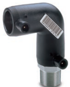
Objednávkové č.: 21.65